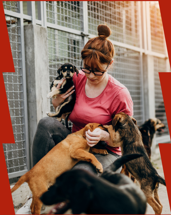
Ein Tier aus dem Tierheim

16 texts with audios, exercises & comprehension questions