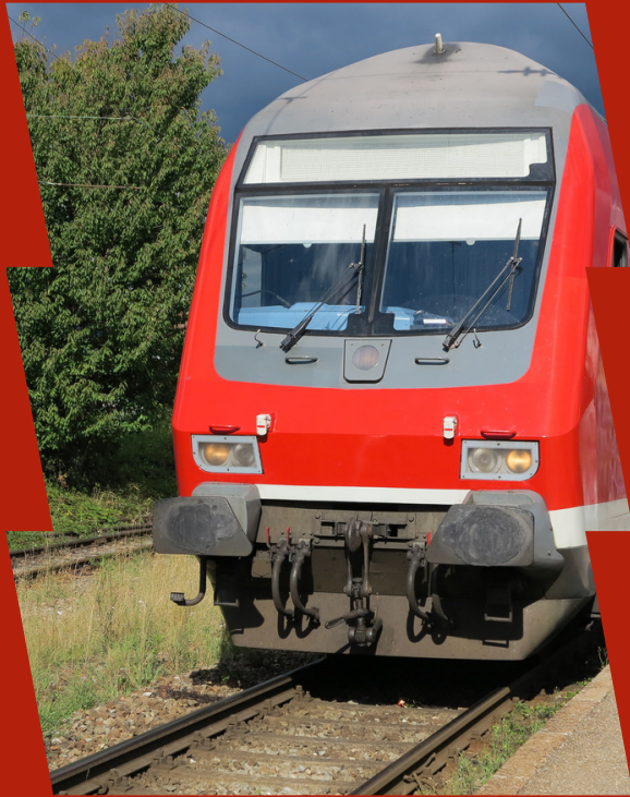
Zugfahren in Deutschland